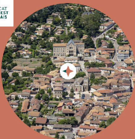
SCoT de l'Ouest : enquête publique